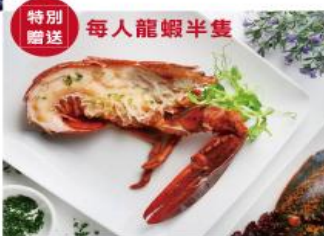
特別贈送 每人龍蝦半隻

海灣自助餐廳菜色豐富，有來自世界各地的200多種菜餚，包括亞洲美食、歐洲美食、日本料理、酒吧及甜點飲料等。 每道料理成功的背後是因為我們有著一群擁有豐富的烹飪經驗且在業界享有聲譽的廚師，希望能滿足每位來海灣自助餐廳享用美食的饕客們。