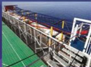
繩索場 主打刺激的海上滑索