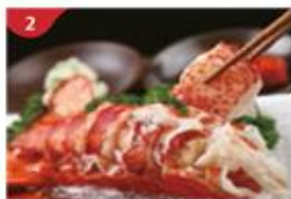
海珍舫 甄選中西式生猛海鮮，更設海鮮自助餐檯