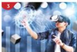
VR探索館 沉浸在繽紛VR遊戲的奇妙虛擬世界，適合全家暢玩