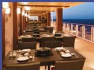
戶外火鍋 可欣賞海景的戶外火鍋