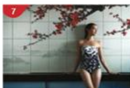
水晶生活 全方位中西式水療體驗，配備健身中心及健康餐吧