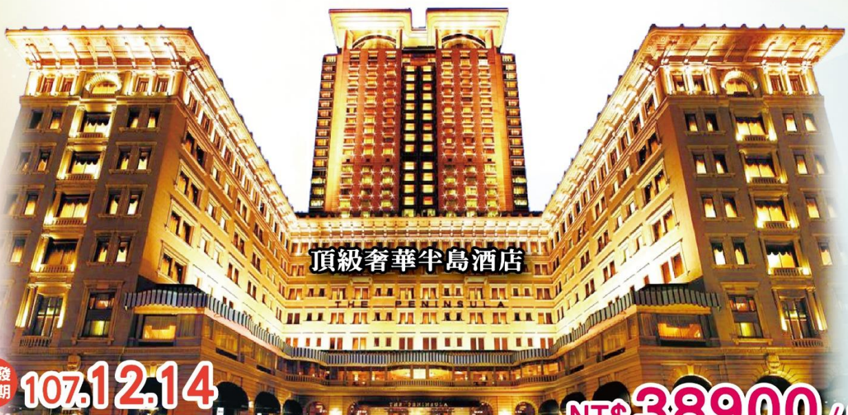
頂級奢華半島酒店