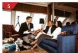
星夢皇宮 尊享歐式私人管家服務及專屬設施