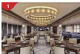
1號扒房 匯集環球頂級牛扒，尊享海上珍饈佳餚