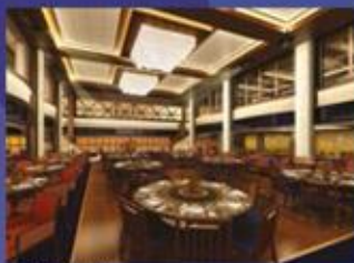
星夢餐廳* 供應亞洲及國際美食的宴會廳