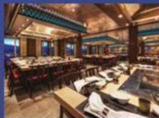
海馬日本料理·鐵板燒及韓式燒烤 體驗海上燒烤樂趣