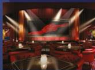
絲路花舞 在懷舊風情中品味中式高端料理