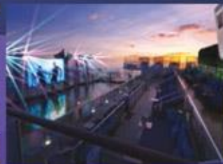
ZOUK海灘派對俱樂部 戶外派對及娛樂場所