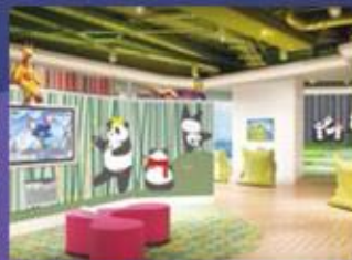
熊貓夢想天地 配備專業看護的兒童俱樂部