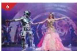
星座劇院 欣賞由藝聲國際的娛樂團隊精心打造的大型表演