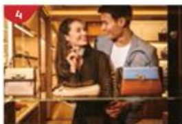
星夢精品廊 匯集環球品牌的免稅購物天地，配備專業專員人員