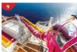
水上滑梯樂園 多達6條各具特色的水滑梯，感受水花四濺的心跳瞬間