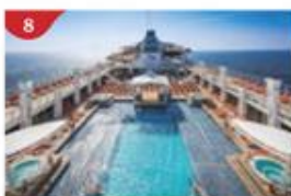
主泳池甲板 在主泳池及兒童嬉水區暢遊，或享受露天日光浴