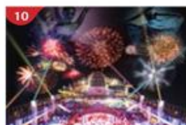
星夢之夜 亞洲獨家海上煙花匯演及戶外激光秀